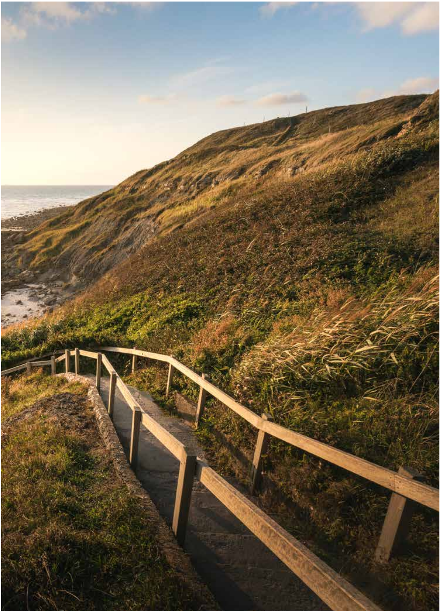
Platier d'Oye, F.Coisy