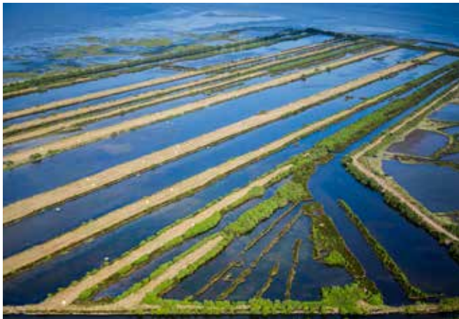
Delta de la Leyre, Gironde, F.Larrey

Il y a 30 ans, le Conservatoire du littoral a pris la mesure des bouleversements qu'exerce le changement climatique sur les littoraux et les rivages lacustres. Il contribue depuis à leur résilience en protégeant des écosystèmes vitaux, tels que les dunes, marais et zones humides, et en favorisant leur évolution de façon souple. Ces espaces naturels agissent comme des boucliers contre l'érosion et les submersions, tout en préservant la biodiversité. Dans le cadre des programmes européens LIFE Adapto et Adapto+, le Conservatoire met en place des projets pilotes de gestion souple de la bande côtière, en associant les acteurs locaux à la gestion et à la création de zones tampons naturelles à travers des projets de territoires plus larges.