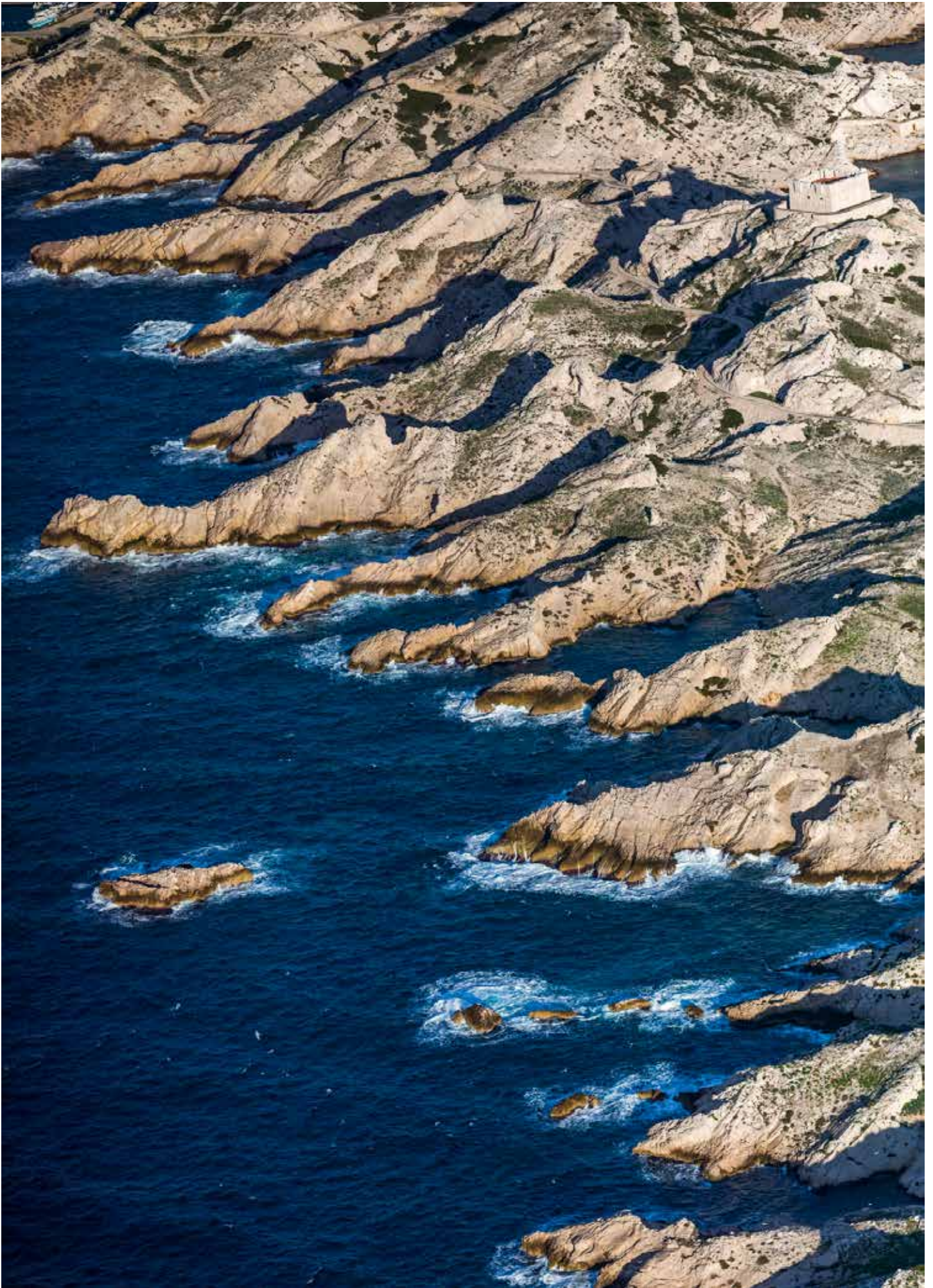
Marseille, Provence-Alpes-Côte d'Azur, F.Larrey