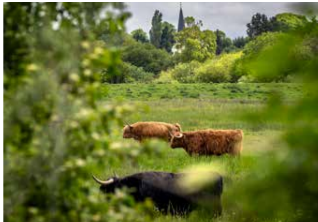
Baie et basse vallée de la Somme, F.Coisy

Les littoraux constituent des carrefours où se succèdent et s'entrecroisent de multiples activités humaines : tourisme, agriculture, pêche, chasse, sports de plein air, activités culturelles... Le Conservatoire du littoral œuvre à intégrer ces usages tout en impulsant, en concertation avec les acteurs locaux, des pratiques durables adaptées aux enjeux écologiques. Le Conservatoire du littoral collabore dans ce sens avec des agriculteurs, des viticulteurs et des saliculteurs par exemple. L'agriculture est en effet considérée comme une composante essentielle de l'économie locale, du patrimoine et des paysages littoraux, pouvant contribuer de manière positive à la préservation et à la valorisation des sites. L'établissement est ainsi attaché, avec l'ensemble des acteurs des territoires, à soutenir cette activité, en accompagnant son adaptation aux enjeux environnementaux (protection de la ressource en eau, de la biodiversité, de la continuité écologique, etc.) ainsi qu'au nouveau contexte climatique.