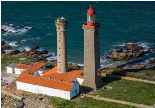
Centre Atlantique, F.Larrey

Les sites du Conservatoire du littoral accueillent chaque année plus de 40 millions de visiteurs. Si le « désir de rivage », pour reprendre l'expression d'Alain Corbin, n'est pas nouveau, il ne cesse de s'accroître. Les événements de la programmation abordent sous des angles complémentaires les enjeux liés à l'ouverture des sites aux publics, ainsi que les projets de conservation, de protection et de valorisation du patrimoine culturel littoral, que l'établissement met en œuvre au profit des visiteurs et des territoires sur lesquels il intervient.