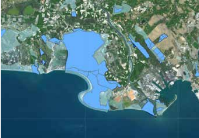
Saintes-Maries-de-la-Mer, Camargue, IGN, Géoportail

L'une des spécificités du Conservatoire du littoral réside dans la diversité des outils mis en œuvre pour l'acquisition foncière publique, permettant de préserver durablement les espaces naturels situés en bord de mer et de lacs de plus de 1 000 hectares. Cette stratégie s'avère particulièrement efficace pour protéger durablement des territoires d'une grande valeur écologique contre l'artificialisation et les dégradations. Unité foncière par unité foncière, elle crée un maillage de zones protégées cohérentes, qui s'étend au-delà du trait de côte, pour inclure des écosystèmes essentiels tels que les estuaires, bassins versants et zones humides. Ces espaces jouent un rôle crucial comme tampons naturels, offrant des services écosystémiques inestimables, tout en abritant une biodiversité remarquable. Grâce à cette action, le Conservatoire du littoral protège aujourd'hui :