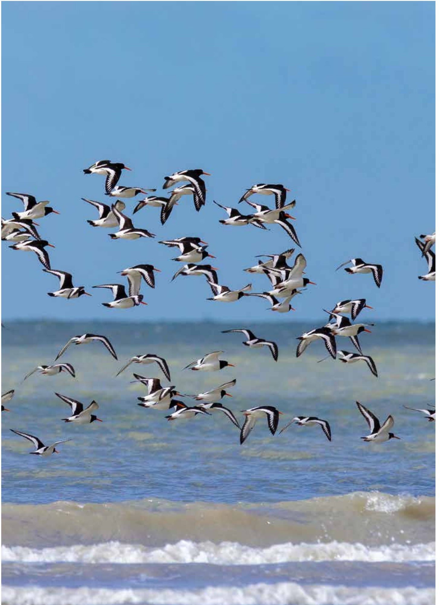
Baie de Canche, Manche Mer-du-Nord, F.Coisy.