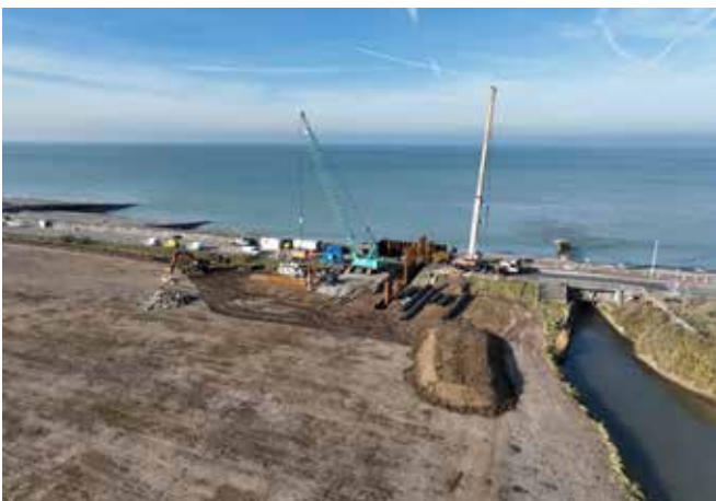
Basse vallée de la Saône, Camille Simon

Bénéficiant du soutien de la Fondation d'entreprise Procter & Gamble France pour la protection du littoral, le Conservatoire du littoral produit chaque année depuis 2021 une émission, diffusée en direct au printemps, à destination des publics scolaires, notamment des cycles 3, 4 et 5. Sous forme de Web TV, l'émission a pour objectif d'enrichir et de diversifier les ressources mises à disposition des écoles et collèges dans le cadre des enseignements en matière d'éducation à l'environnement et au développement durable. Les émissions combinent la diffusion de reportages sur le terrain et des interventions en direct en studio d'experts du Conservatoire du littoral. En 2024, 500 écoles se sont connectées pour suivre une émission dédiée à la ressource eau et au changement climatique. L'édition 2025 va porter sur le thème de la renaturation des espaces naturels littoraux, à travers le cas pratique de trois sites: Jarry en Guadeloupe, la baie de Lancieux en Bretagne et la vallée de la Basse Saône en Normandie.