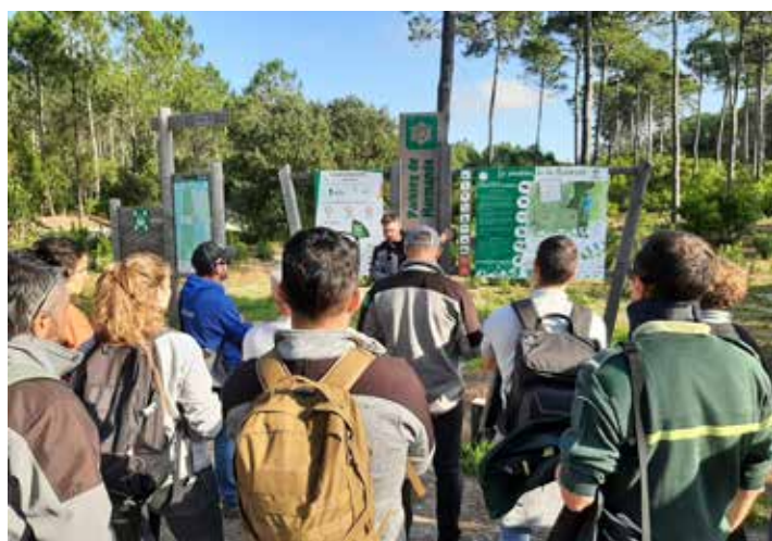
Gardes-Aquitaine, 2024, G.Moreau