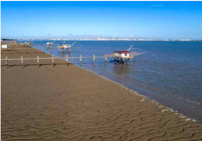
Estuaire de Loire, Conseil départemental de Loire-Atlantique

L'adaptation des territoires et des populations aux défis climatiques constitue un enjeu majeur du 21 e siècle qui guide l'action du Conservatoire du littoral sur les sites dont il a la responsabilité. Les événements organisés offriront un espace d'échange pour explorer les différents possibles, tout en renforçant l'implication des acteurs locaux dans les nécessaires évolutions de ces espaces.