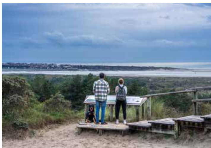
Baie de Canche, F.Coisy

Plus de 50 balades, organisées sur 50 dates, du printemps à l'automne 2025, dans l'Hexagone et en Outre-mer, inviteront le public à une exploration sensible et itinérante du littoral et des rivages lacustres. Chaque balade est conçue par les délégations de rivages du Conservatoire du littoral, en lien avec ses gestionnaires et partenaires, autour d'un angle de découverte original, spécifique aux sites parcourus, et de rencontres avec des intervenants – agents et gardes du littoral, naturalistes, artistes, paysagistes... – qui en éclairent les enjeux. Chaque sortie proposera une expérience sensible et des échanges, avec pour objectif de comprendre le littoral dans sa dynamique en constante évolution, façonnée par la nature, les éléments et les activités humaines. La marche, qui devient « arpentage » des sites, les informations fournies, les activités proposées, individuelles et collectives, permettront aux participants à la fois de (re)découvrir un territoire et de mieux se l'approprier, même lorsqu'il est vécu comme familier, pour contribuer à toujours mieux le préserver.