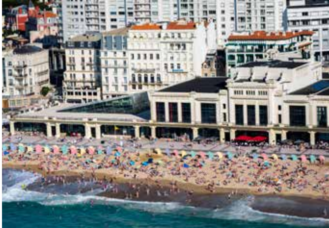
Plage centrale de Biarritz, Aquitaine, F.Larrey