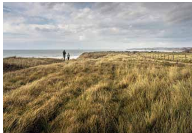
Manche-Mer du Nord, F.Coisy

Cette journée d'étude interdisciplinaire propose de réunir des acteurs académiques et scientifiques de différents horizons (philosophie, sociologie, écologie, droit, etc.) aux côtés de praticiens afin d'éclairer, par leurs recherches, idées et expériences de terrain, la notion d'accès à la nature, qui se situe au cœur des missions du Conservatoire du littoral. Un décentrage de la vision uniquement occidentale et une prise en compte des usages du numérique seront proposés. La journée vise ainsi à repenser les enjeux liés à l'accessibilité des espaces naturels, les freins culturels, sociétaux et économiques, les tensions entre préservation des espaces naturels et fréquentation humaine, ainsi qu'à identifier des pistes de travail pour dépasser les antagonismes et répondre au besoin, de plus en plus pressant, de nature.