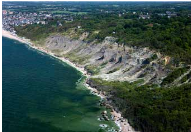
Vaches noires, Normandie, F.Larrey