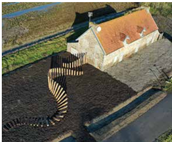
Œuvre « Relier : à l'abri dans la marée », Beausseis-sur-Mer, 2023, Nancy Lamontagne, Antoine Collin