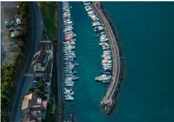
Lac Léman, F.Larrey

Il y a un demi-siècle, par la loi du 10 juillet 1975, naissait le Conservatoire du littoral, un établissement public de l'État, inédit par son organisation déconcentrée, son approche partenariale et sa vision avant-gardiste de l'action environnementale. Le contexte ? À la fin des années 1960, au moment des Trente Glorieuses, certains littoraux français subissent de plein fouet une urbanisation effrénée et le développement du tourisme de masse. Ces espaces aussi attractifs que fragiles sont en péril. Une idée audacieuse émerge alors : doter le pays d'un outil national qui lui permette, en concertation avec les acteurs locaux, d'acquérir les sites les plus menacés pour les classer dans le domaine public, les rendre inaliénables, les restaurer, les valoriser et les ouvrir au public. Aujourd'hui, avec plus de 218 000 hectares protégés, ce modèle unique fondé sur la coopération et le dialogue, continue de démontrer son efficacité et demeure plus que jamais indispensable pour contribuer à la résilience des zones littorales face aux défis du changement climatique.