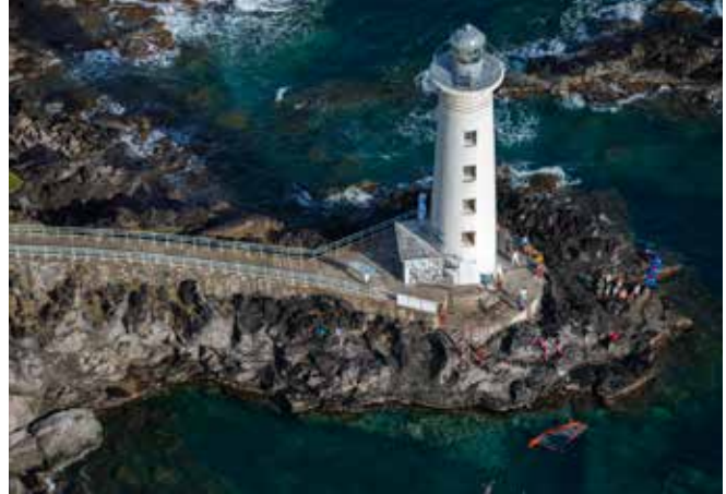
Vieux-Fort, Guadeloupe, F.Larrey

Exceptionnel par sa diversité, le patrimoine naturel et bâti des espaces littoraux et des rivages lacustres en fait le « premier site touristique de France ». Loin de toute sanctuarisation des sites qu'il protège, le Conservatoire du littoral adopte, avec les collectivités locales et les gestionnaires, une approche concertée et équilibrée pour accueillir le public tout en assurant leur intégrité et la biodiversité qu'ils abritent. Sa mission est claire : préserver ces espaces et les ouvrir au plus grand nombre possible, tout en assurant leur transmission aux générations futures. Avec l'appui de ses gestionnaires, l'établissement contribue par ailleurs à la connaissance et à la valorisation des édifices, témoins de l'identité et de l'histoire des littoraux, à l'aménagement de sentiers et de points d'observation favorisant la découverte. Des actions de médiation et de sensibilisation du public aux enjeux écologiques et aux bonnes pratiques sont également menées, tandis que des équipements, tels les maisons du littoral et autres lieux d'accueil du public, et des offres et ressources pédagogiques sont proposés.