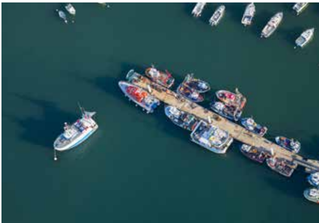
Port de Quiberon, Bretagne, F.Larrey