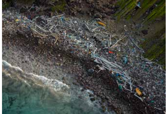
Les Saintes, Guadeloupe, F.Larrey.