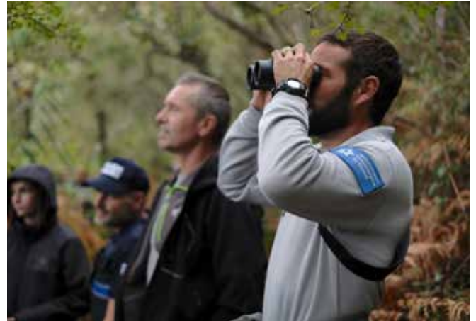
Réunion garderie du littoral, Aquitaine, 2019, F. Chenel

Pour protéger et valoriser les sites acquis ou affectés, tout en répondant aux enjeux locaux, le Conservatoire du littoral travaille de concert avec les collectivités territoriales et s'appuie également sur des acteurs de proximité, associations et établissements publics spécialisés pour la plupart. En tant que gestionnaires des sites, ces acteurs, grâce à leur connaissance fine du terrain et des dynamiques locales, complètent l'action stratégique du Conservatoire. Ensemble, ils préservent et valorisent les espaces naturels et le patrimoine bâti qu'ils abritent. Le Conservatoire du littoral conduit de nombreuses opérations de travaux chaque année (restauration, renaturation, aménagements paysagers...), tandis que les gestionnaires, avec l'appui de leurs agents et gardes du littoral, assurent la gestion au quotidien, ainsi que la surveillance et l'accueil des visiteurs. Cette collaboration, fondée sur la complémentarité des compétences, permet de répondre efficacement aux défis écologiques et sociétaux de ces territoires.