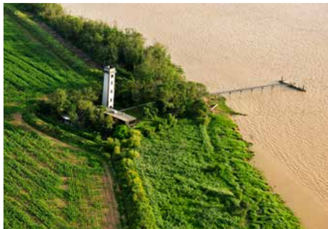
Centre Atlantique, F.Larrey

Les relations extrêmement fortes que nos sociétés entretiennent avec le littoral et l'empreinte qu'elles y ont laissée ont abouti au fil des siècles à un patrimoine culturel unique, qui participe à l'identité et à la richesse de ces territoires. En tant que propriétaire d'un domaine public abritant des biens culturels de grande valeur, le Conservatoire du littoral est attaché à révéler ce patrimoine, à le préserver et à le partager auprès du plus grand nombre. Il s'agit également pour l'établissement de mieux connaître et de faire connaître son patrimoine immatériel et, dans le nouveau contexte climatique, d'investir les notions d'effacement et de traces face à l'inexorable disparition de certains biens matériels. C'est finalement la notion de mémoire qui revient au cœur du débat. Cette journée d'étude propose un éclairage sur ces différents sujets à travers le dialogue entre recherche scientifique et pratique de terrain, à partir de cas d'études sur le littoral et au-delà.