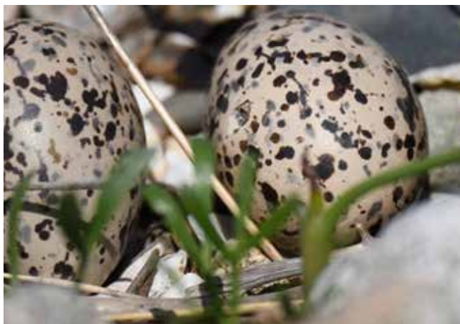
Œufs de grand gravelot

Le 27 mars 2025, la 6 e édition de la campagne nationale de sensibilisation et de préservation de la biodiversité Attention, on marche sur des œufs! sera lancée au Lido des Aresquiers, en Languedoc-Roussillon. Le Conservatoire du littoral, l'Office français de la biodiversité, l'Office national des forêts, la Ligue pour la Protection des Oiseaux, Rivages de France, en partenariat avec de nombreuses associations et gestionnaires de sites, appellent à la vigilance sur les plages, avec cette campagne nationale qui se déploie sur plusieurs semaines et sur l'ensemble du territoire. L'opération vise à sensibiliser les usagers du littoral à la fragilité des écosystèmes littoraux et au respect de la faune sauvage, en particulier en ce qui concerne les espèces d'oiseaux, tels les gravelots, les sternes ou les huitriers, qui nichent sur le littoral.