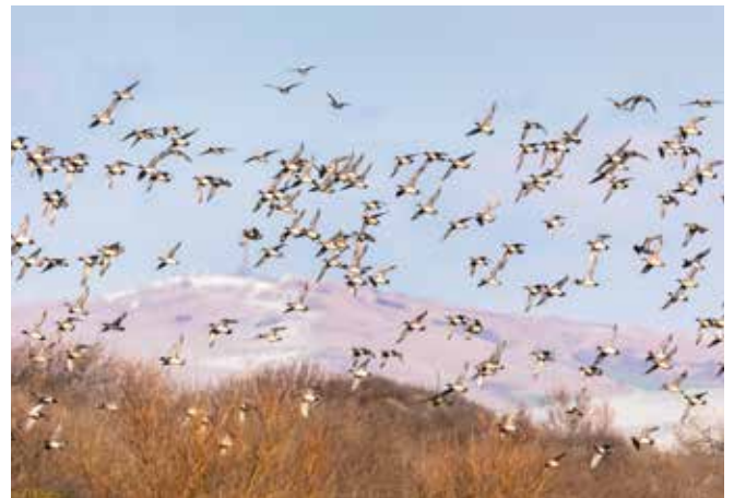
Baie de Canche, F.Coisy

Cette journée d'étude explorera la question de la gestion et de la connaissance du patrimoine naturel face aux enjeux du changement climatique. Dans un contexte où la vision fixiste du patrimoine écologique a longtemps dominé, nous interrogerons comment le Conservatoire appréhende aujourd'hui la question de la biodiversité dans un monde en perpétuelle évolution. Loin d'un capital naturel statique, il est désormais nécessaire de considérer les transformations des aires de répartition des espèces, aussi bien fauniques que floristiques. La dynamique actuelle invite à repenser les approches d'inventaire dans un monde en mouvement, en intégrant une vision dynamique voire prospective.