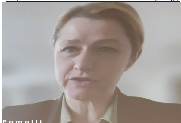
Barbara POMPILI, secrétariat national à la planification écologique, international https://www.dailymotion.com/video/x8vedde