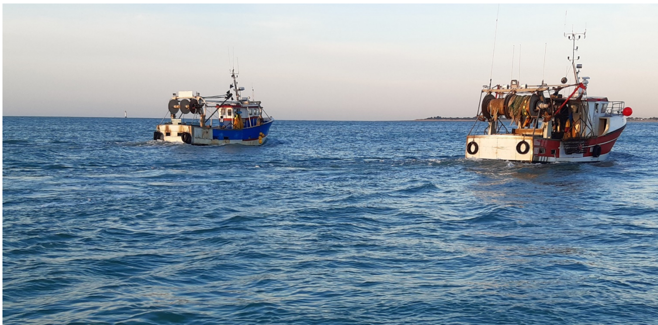
Pêche dans les pertuis