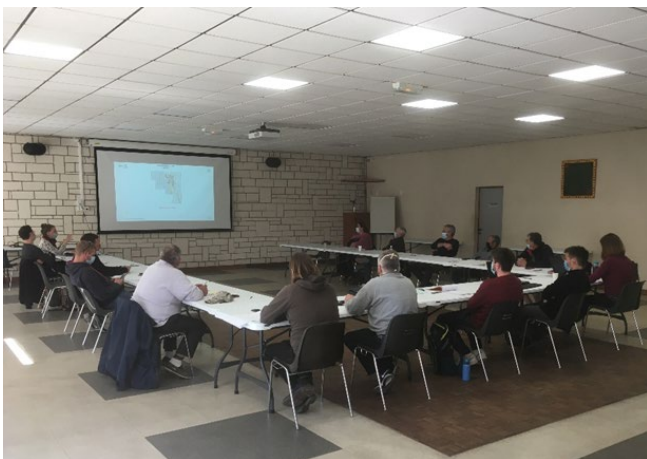
Présentation du projet aux pêcheurs, fin mars

Ces dernières semaines, les chargés de mission du Parc sont allés rencontrer les pêcheurs de différents ports pour leur présenter le projet « Analyse Risque Pêche Pertuis Gironde » (ARPEGI). Ces temps d'échanges ont permis d'associer des pêcheurs au projet et de compiler les premiers retours d'expérience terrain indispensables à l'étude.