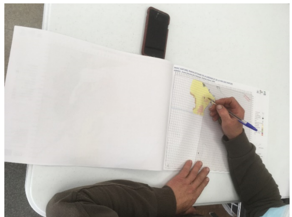
Partage des connaissances avec les pêcheurs de Royan

Ces tables rondes étaient également l'occasion d'écouter les interrogations et les inquiétudes des pêcheurs quant aux mesures réglementaires qui pourraient découler de ce travail.