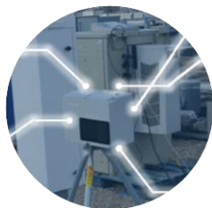
Des données GES basées sur de la mesure scientifique

1 er système de monitoring urbain des gaz à effet de serre