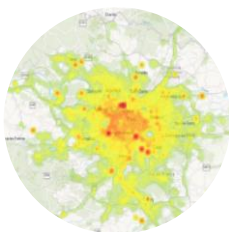
Indice carbone urbain & suivi d'impacts